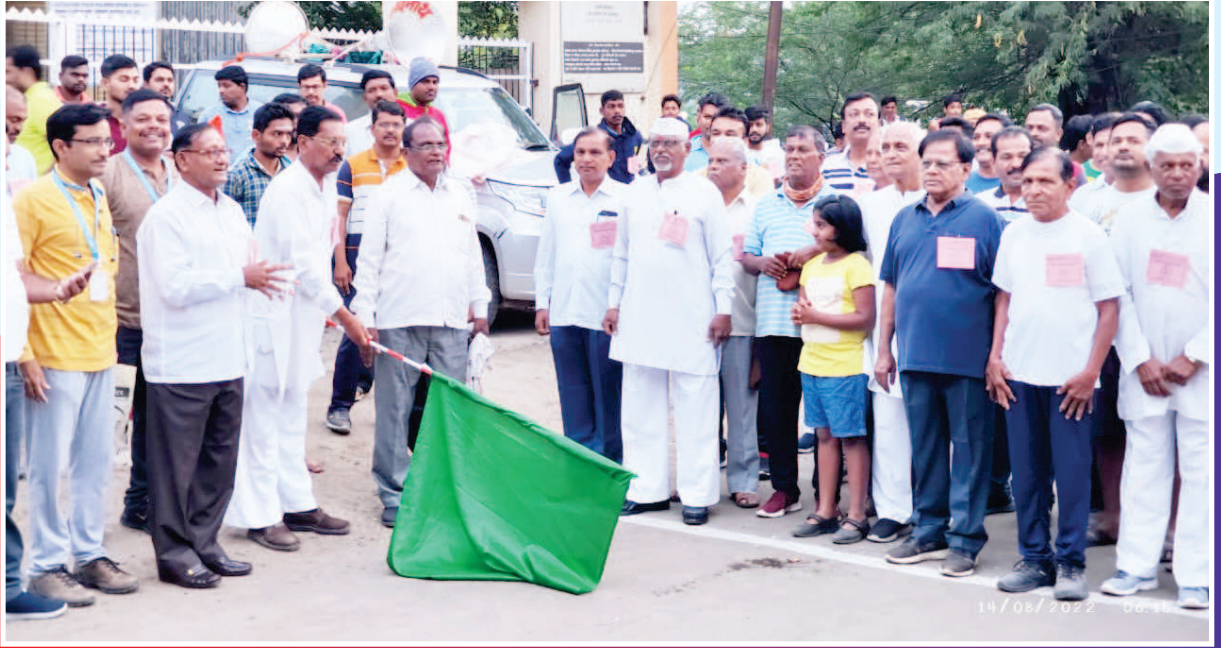
बँकेच्या वर्धापनदिनानिमित्त आयोजित जलद चालण्याच्या स्पर्धेचे उद्घाटन करताना